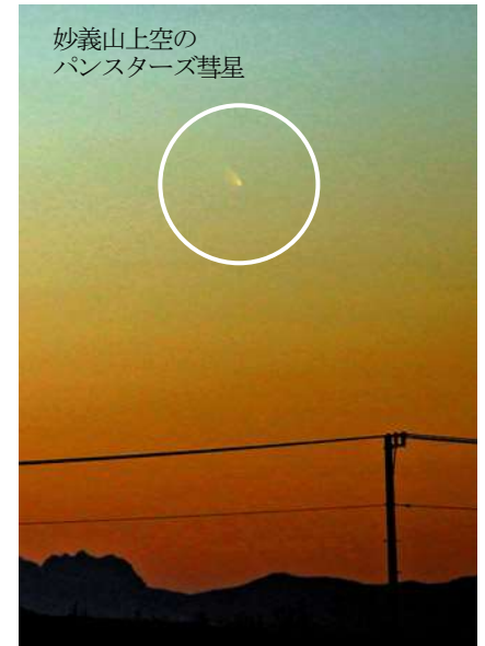
妙義山上空の パンスターズ彗星

離心率:1より小さいと楕円で閉じているが、1以上は双曲線、放物線で、閉じていない。