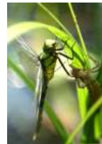
クロスジギンヤンマの羽化