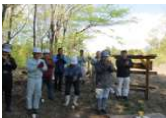
年度最初の安全祈願