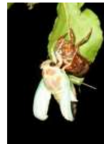
アブラゼミの羽化