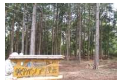
整備終了頃 看板も設置