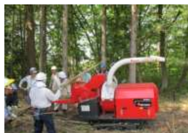
強力なチップパー