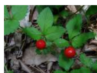
(図4. ヤブヘビイチゴ)