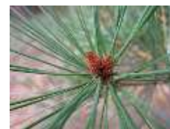
アカマツの冬芽は赤っぽい

受粉した雌花は翌年の秋に熟し、鱗片状の種鱗が木質化して堅くなり、長さ数cmの卵形状の球果(松かさ、松ぼっくり)になります。それぞれの種鱗の内側に翼のある種子が2個ついています。球果と呼びますが、裸子植物なので果実ではなく、種子を持つ種鱗が軸に集合したものです。樹上の球果は熟すと下向きになり、乾くと種鱗が反り開いて、種子を放出します。種子は風に乗って、広い範囲に散布されます。