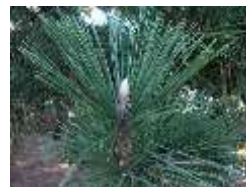
クロマツの冬芽は、白っぽい