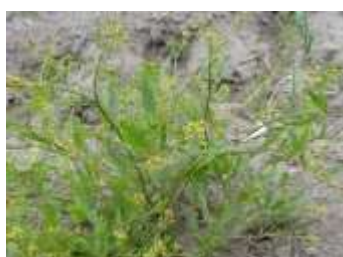
(図2. スカシタゴボウ)